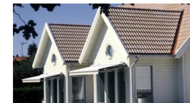
NOVA MARCESA & NOVA CLASSIC