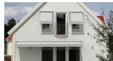
ROYAL & ROYAL CROWN